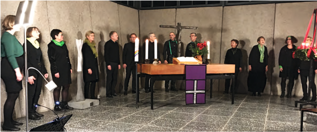
Der Jazzchor Celle singt stimmungsvoll beim Meditativen Abendgottesdienst in der Kreuzkirche am 4. Advent.