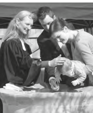
Taufe am Brunnen