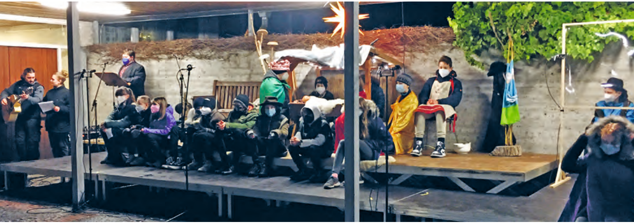
Open-Air-Krippenspiel der Vorkonfis im Innenhof bei Regen und Heilig Abend auf dem Landgestüt