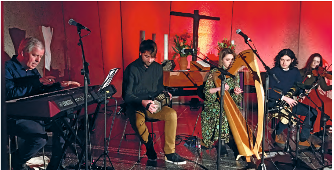
Celtic Christmas-Night in der Kreuzkirche