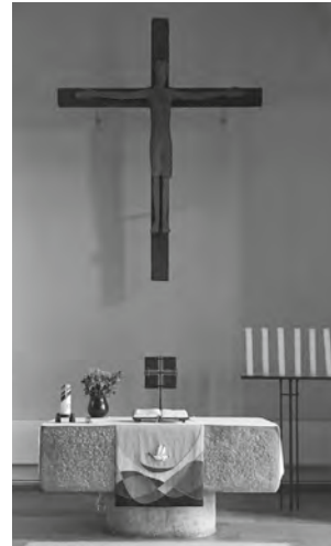
Die Neuenhäuser Kirche

PS: Das Offene-Kirche-Team sucht Verstärkung! Hätten Sie Zeit & Lust? Bitte melden!