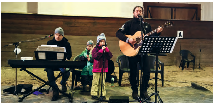
„Winterzeit, Weihnachtszeit...“ Gesang in der Reithalle auf dem Landgestüt am 2. Advent