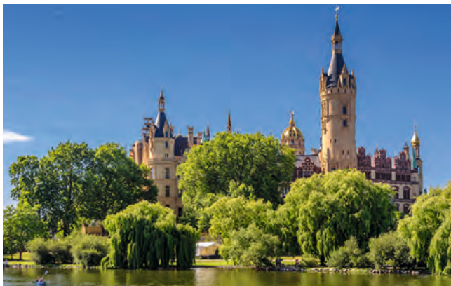
Das Schweriner Schloss malerisch direkt am See

Kosten: im Doppelzimmer: 260,- € pro Person Einzelzimmerzuschlag: 86,- €