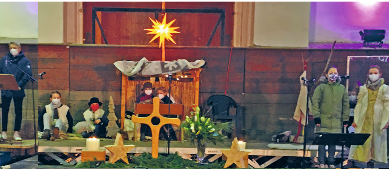
Krippenspiel Heilig Abend auf dem Landgestüt für die Familien mit kleinen Kindern